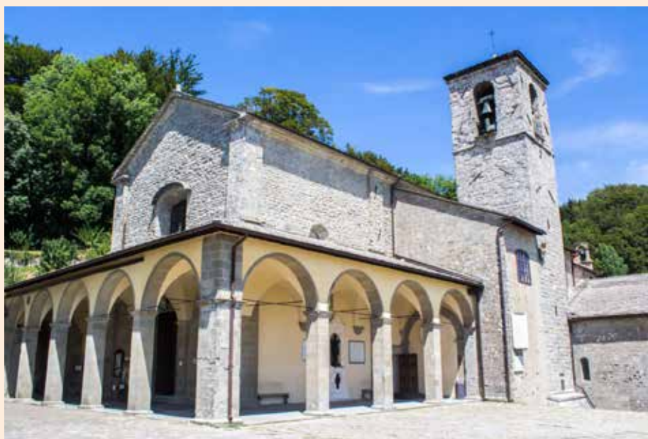
La basilica de La Verna.

Chi non conosce La Verna ed il famoso Santuario ha perso l'occasione di visitare uno dei luoghi più affascinanti e magici delle Foreste del Casentino. Boschi di faggi baciati dai secoli immersi nel luogo francescano per eccellenza ci accolgono e invitano a visitare i siti più segreti del santuario dove visse e morì S. Francesco. L'escursione a piedi, prevede dai sette ai dieci chilometri per una passeggiata di vera spiritualità, nel tempio della natura rimasta incontaminata. Il 14 settembre 1224 segna la storia de La Verna, da allora meta di migliaia di visitatori che arrivano da ogni parte del mondo. Arte, fede, cultura, e storia della vita di S. Francesco, resteranno immutate nei tempi, con le testimonianze storiche e monumentali della chiesa di S. Maria degli Angeli, (1250-1260) e la Basilica di S. Maria Assunta, (1348). Importante visitare la Cappella delle Reliquie, dove si conserva il saio di