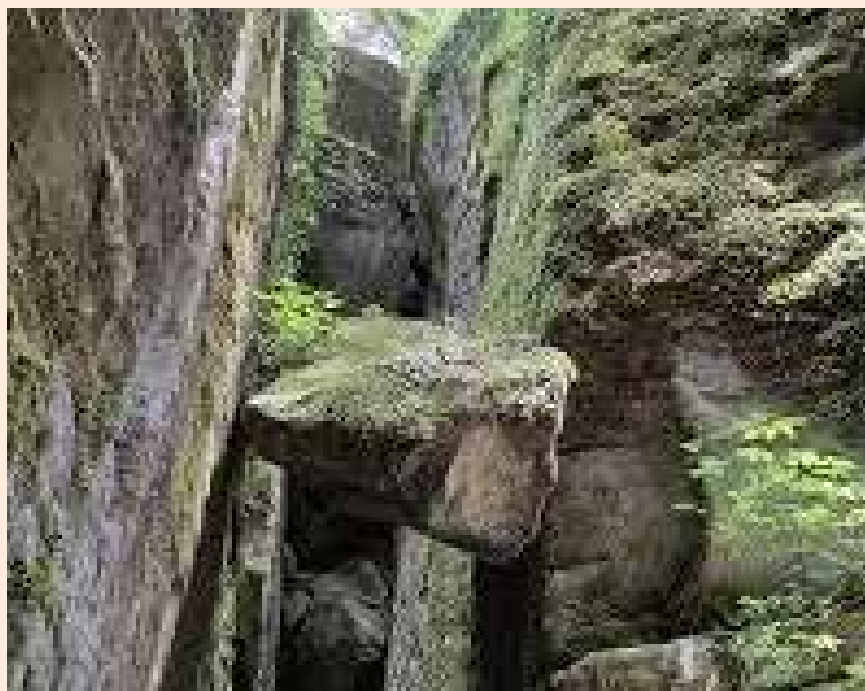
Il famoso Sasso Spicco che sfida la forza di gravità.