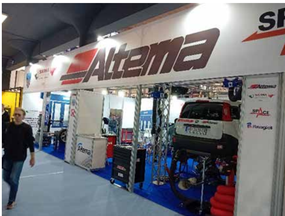
Il nostro stand in fiera.

"Non un risultato a caso - continua Valeri - perché la Serbia vive un momento di buon sviluppo economico e sociale. Inoltre la sua neutralità nel conflitto Russo - Ucraino le permette di attrarre entrambi gli investitori di questi 2 Paesi che trovano uno sfogo naturale in questo territorio di lingua slava e alfabeto cirillico. C'è poi il fatto che la Serbia sta trattando anche la sua entrata nella Comunità Europea. Questo percorso di avvicinamento all'Europa, infatti seppure con un iter che prevederà tempi medio-lunghi, è un altro tassello che attira investitori anche da altre zone. Per questo si registra una presenza crescente di italiani, tedeschi, francesi ecc.