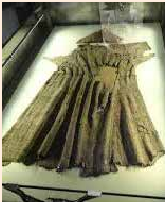
Il saio di S. Francesco custodito nella Cappella delle Reliquie.

S. Francesco. Sul pavimento c'è una lapide che segnala il punto dove avvenne il "miracolo delle stimmate" ricevute dal Santo. Ma il vero mistero che sfida la forza di gravità e le normali regole dell'equilibrio gravitazionale sta nel trovarsi di fronte al " Sasso Spicco " dove il "poverello di Assisi" era solito inginocchiarsi in preghiera di fronte alla montagna granitica. Ancora oggi, quel lembo di pietra sospeso non crolla. E non c'è architetto che sappia trovare una risposta razionale a questo straordinario miracolo della natura. Andate a vederlo!